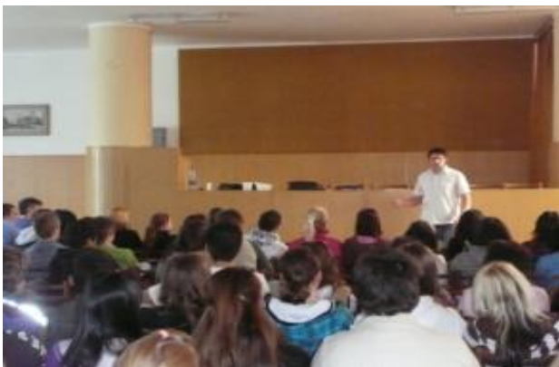
Najlepšia prevencia je drogy nikdy nebrať