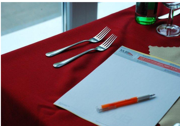
Školenie „Spoločenskej etikety a diplomatického protokolu“