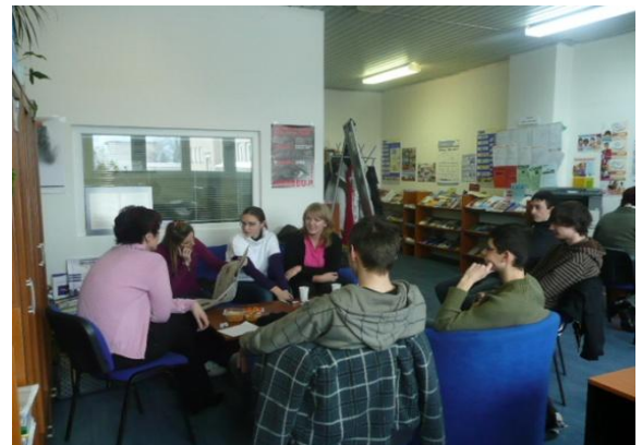
Zasadnutie členov Parlamentu mladých