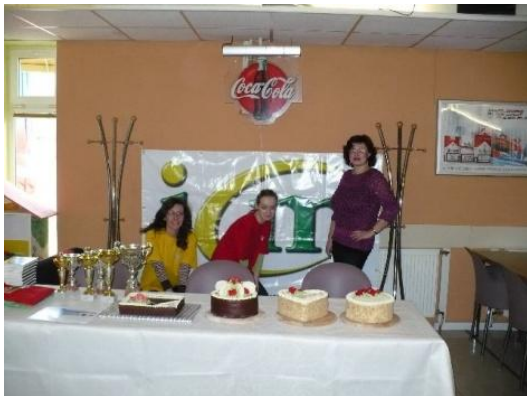
Deň študentstva - turnaj v bowlingu