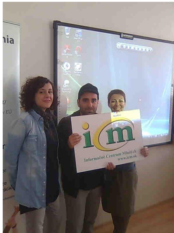
Dobrovoľníci EDS na prezentácii na stredných školách