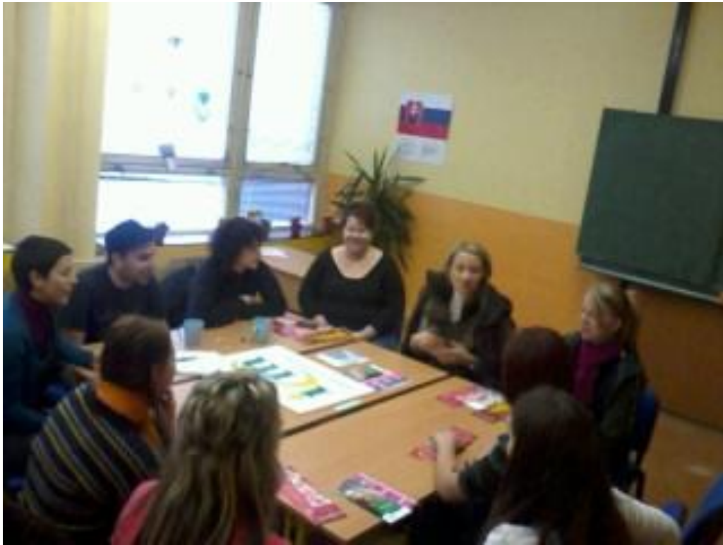
Prezentácie ICM v Humennom na strednej škole