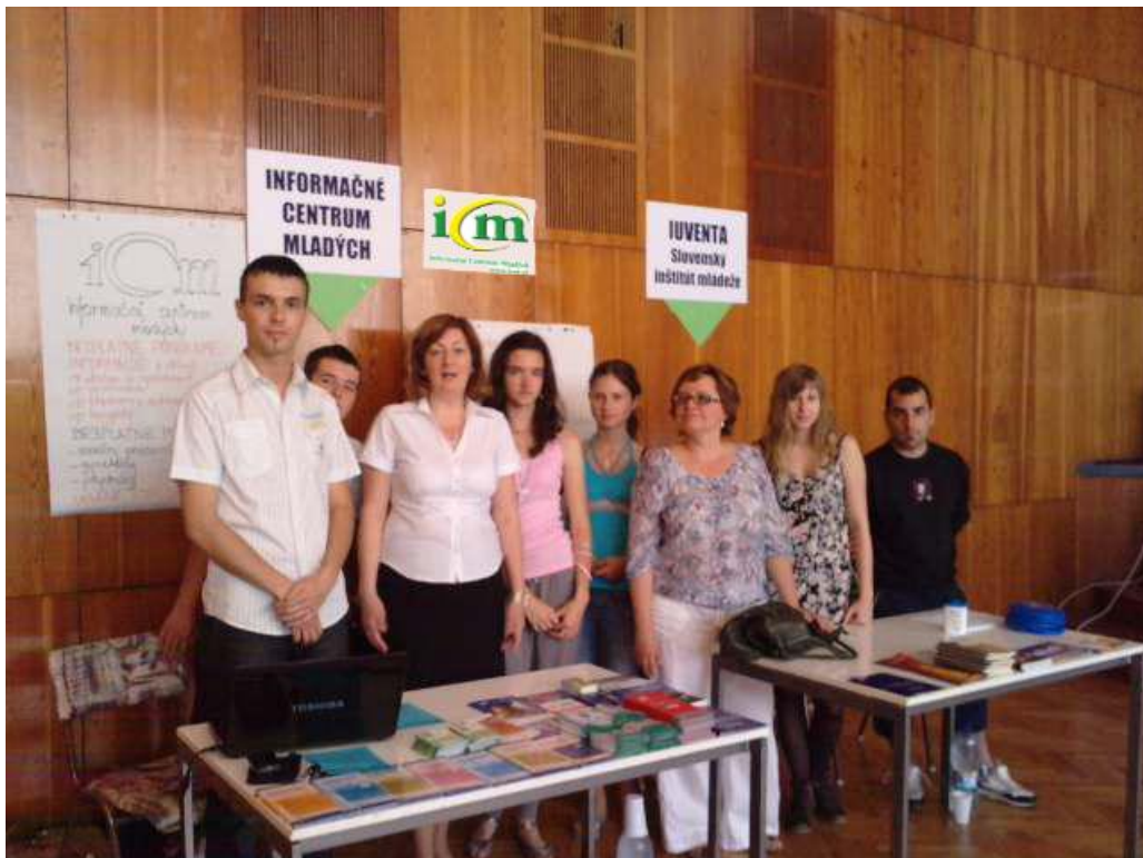
Slovensko – poľská burza informácií s počtom účastníkov viac ako 1000