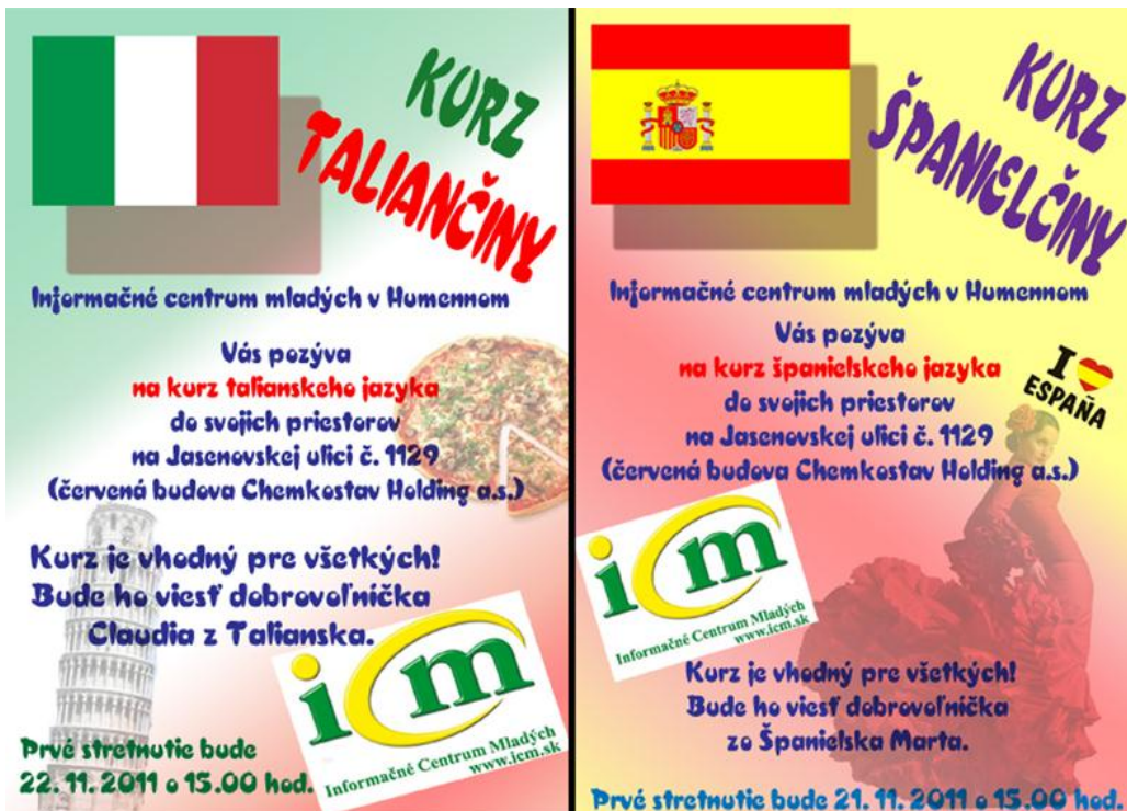
Spolupráca s dobrovoľníkmi EDS pri neformálnych jazykových kurzoch