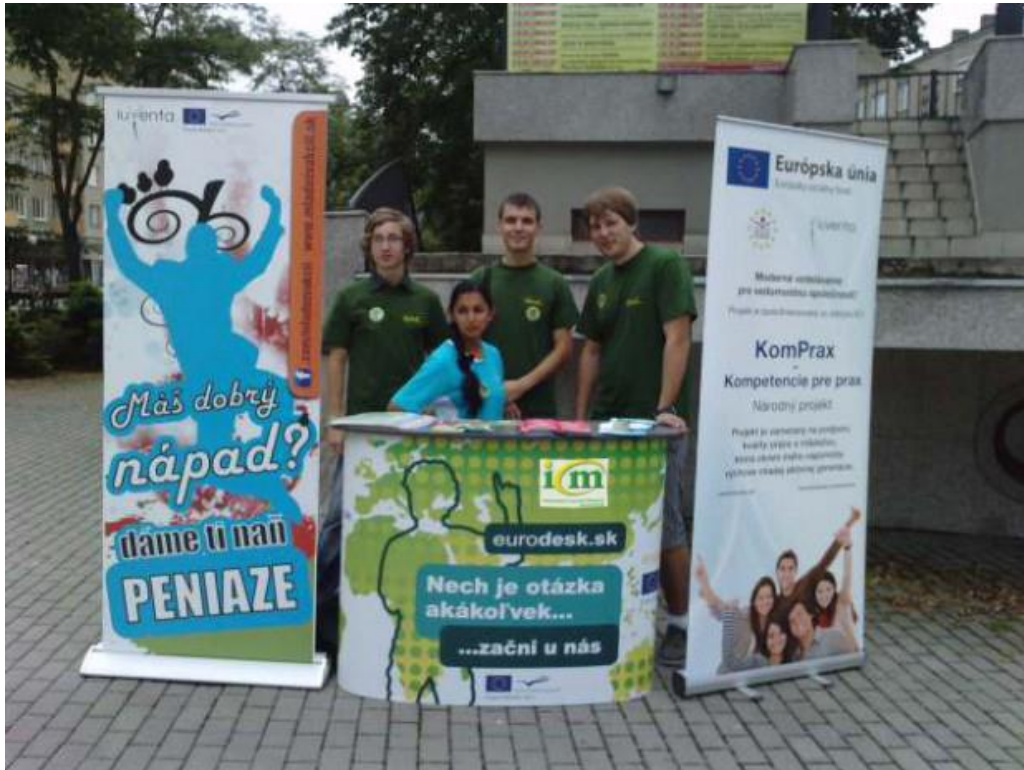
Infodays v regióne. Informačný týždeň v mestách regiónu